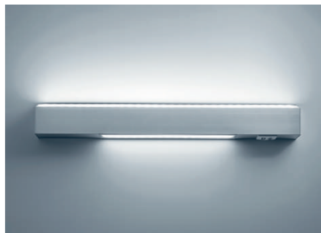
Tripla accensione separata: doppia accensione a luce diretta e accensione singola a luce indiretta. Three way switching: double direct light switching and single indirect light switching.