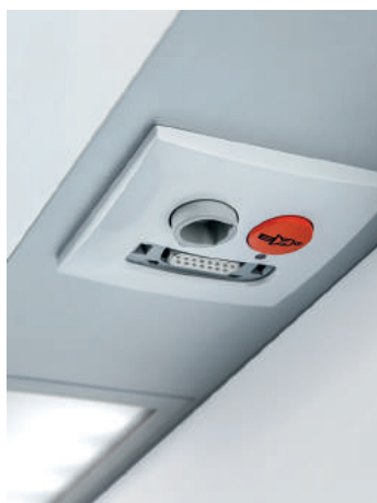
Unità di comando su richiesta (personalizzabile dal cliente). Bespoke control unit on request.